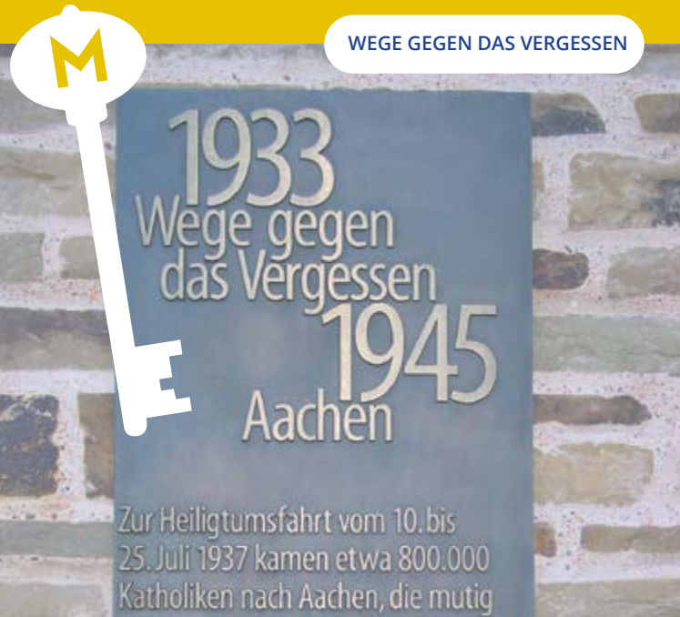
WEGE GEGEN DAS VERGESSEN

DONDERDAG 22 SEPTEMBER 14.00 - 15.30 UUR RONDLEIDING 'WEGE GEGEN DAS VERGESSEN' IN AKEN DOOR DR. H. A. DUX 25 jaar geleden werd 'Wege gegen das Vergessen' opgericht met als doel de gebeurtenissen die tussen 1933 en 1945 plaatsvonden niet te vergeten maar te blijven herinneren. Bij deze rondleiding loopt u langs een aantal van de 43 geplaatst informatieborden en herdenkingstekens in Aken. Trefpunt: Aken, voor het Raadhuis op de Markt. Ism Rheinischen Verein für Denkmalpflege und Landschaftsschutz e.V. Regionalverband Euregio Aachen. Gratis / Reserveren: tel. 045 7630520 of info@bibliotheekkerkrade.nl